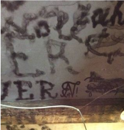
天井の落書き。ろうそくの煤で。