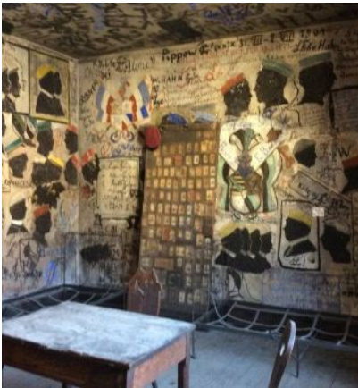
部屋のいたる所に落書き。